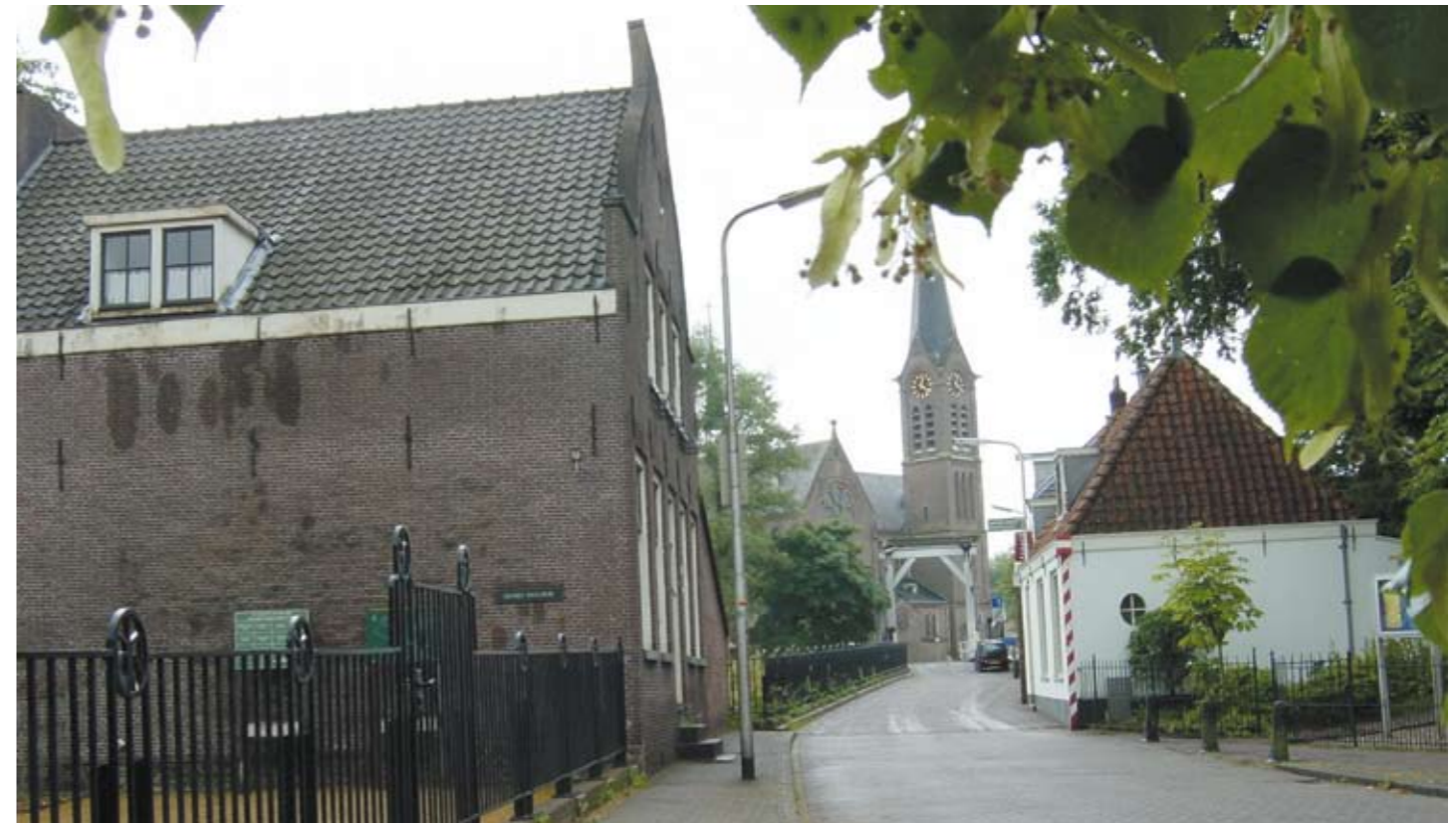
Het Vega Huis