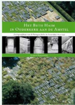
Het Beth Haim in Ouderkerk aan de Amstel