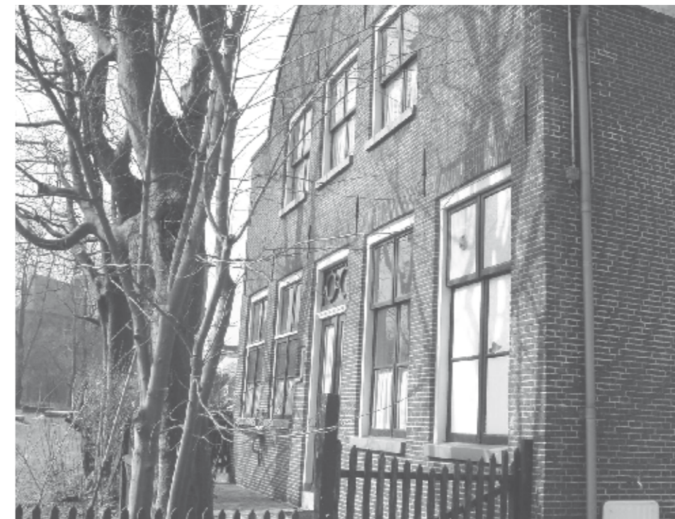
Het Vega Huis

Het Alvares Vega Huis is genoemd naar onze Vader z.l. Zijn naam staat prominent boven aan de zijgevel van het huis aan de ingang van de Portugese Israëlitische Begraafplaats. Voor menige passerende Ouderkerker en arriverende begraafplaatsbezoeker roept de naam warme herinneringen op aan de man die zo bekend stond om zijn verdiensten voor zowel de begraafplaats als het dorp. Vader woonde in dat huis vanaf januari 1937 toen hij aangesteld werd als bewaarder van de begraafplaats. Een half jaar later trouwde hij met Moeder en samen zijn ze er 49 jaar blijven wonen. Zijn taak was het leiden van begrafenissen, het ontvangen van bezoekers en het toezicht houden op het onderhoud. Moeder stond hem daarbij terzijde.