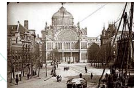
Paleis van de Volksvlucht, op de huidige locatie staat de Nederlandse Bank

was uitgebroken. Zijn dood was wel onverwacht. In de avondeditie van de Amsterdamsche Courant heet de begrafenis eenvoudig maar hoogst indrukwekkend. Duizenden mensen, van alle rangen, standen en geloofsbelijdenissen, verzamelden zich ernstig en verdrietig langs de grachten, de straten en op de bruggen rond het sterfhuus. Voor het huis verzamelden zich bekenden en familieleden. De lijkwagen werd gevolgd door dertig rijtuigen; ook drie stoomboten voeren naar Ouderkerk. Het was duidelijk dat Sarphati met recht een man des volks werd genoemd.