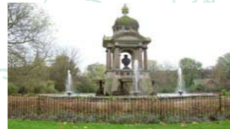
Monument ter nagedachtenis aan Gemeenteraadslid van Amsterdam en huisarts Dr. S. Sarphati in het naar vernoemde Sarphatipark te Amsterdam