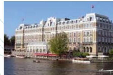
Amstel Hotel aan de Amstel